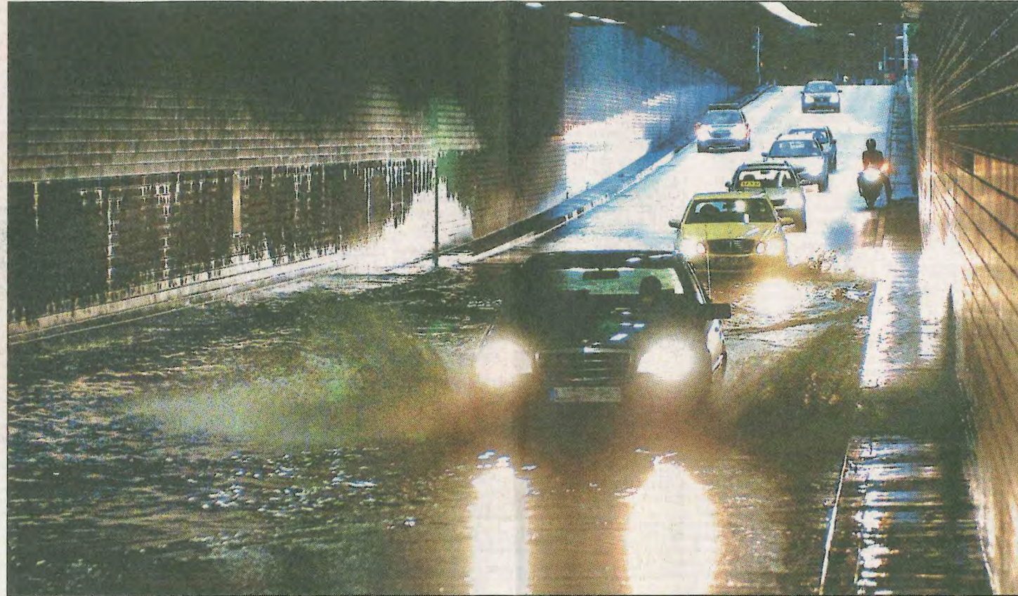
Vollgespült wurde dieser Tunnel in Ludwigshafen vor vier Jahren nach einem Unwetter in der Region.

Für ganz Baden-Württemberg gibt es bereits Kartenmaterial mit einer Auflösung von etwa einem Meter, das die mit Hilfe von Laser-Scans erfasste Topografie des Bodens wiedergibt. Auf der Basis solcher Karten, so André Assmann von der Geomer GmbH, ist es möglich, mit-